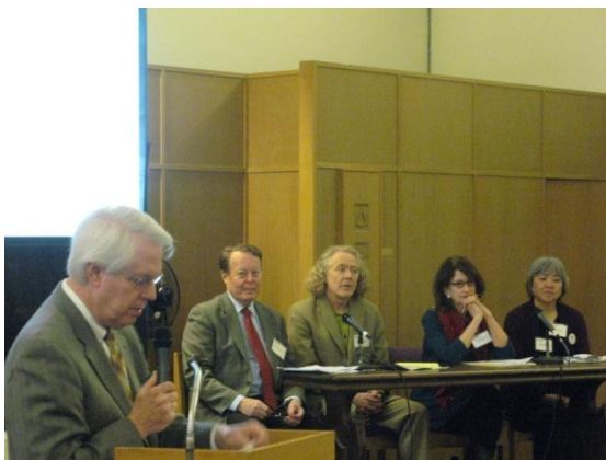
モデレーターとパネリスト

パネリストからは、日本の食品に対する基準は大変厳しく市場に出回ってい る日本産食品は安全であること、福島第一原子力発電所事故による海洋等への 影響については客観的なデータを参照することが重要であること、東日本大震 災の教訓は地震の多い当地でも活かすべきであり実際に日本の自治体との間で 防災に関する協力プログラムが開始されていること、被災地は引き続き多くの 課題を抱えているが日本のほとんどの地域はビジネス・観光・留学にオープン であること、などが述べられました。