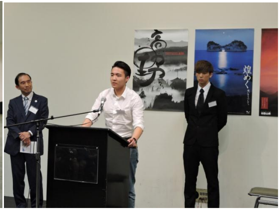
日本語スピーチコンテスト優秀者のスピーチ披露

当日は天候にも恵まれ、いずれのイベントも多くの参加者・来場者でにぎわい、日本文化を多くの方に知っていただくよい機会となりました。