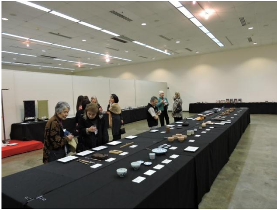
国際交流基金巡回展の様子